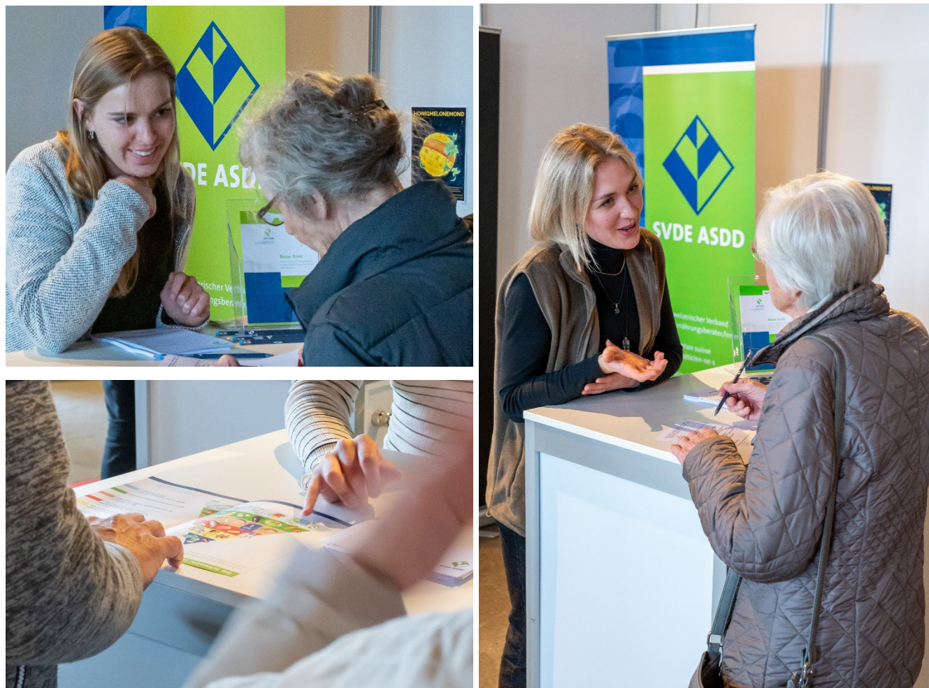
Présence de l'ASDD au « Treffpunkt Gesundheit » de la ville de Lucerne, du 11 au 13 mai 2023.