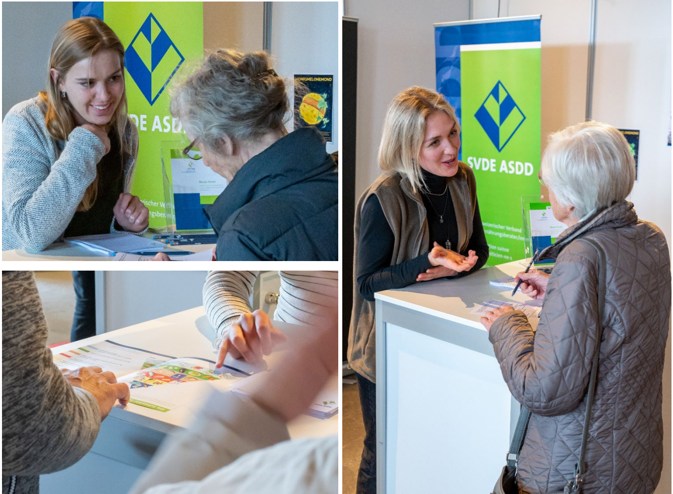
SVDE-Präsenz am «Treffpunkt Gesundheit» in Luzern, 11.-13. Mai 2023