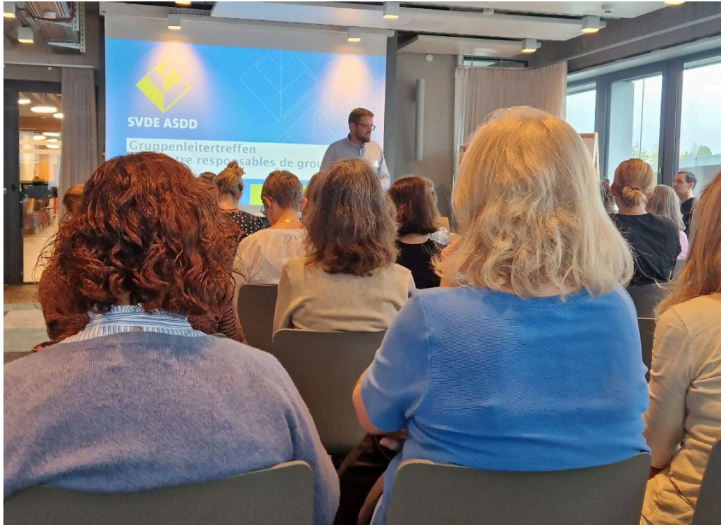
Treffen der Gruppenleiter/innen vom 27. Oktober 2023