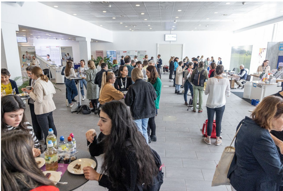
NutriDays 2023 in Lausanne

Die Vernetzung und der Fachaustausch unter den Mitgliedern hatten auch 2023 einen grossen Stellenwert. Die NutriDays fanden 2023 zum ersten Mal seit der Pandemie wieder als Präsenzveranstaltung statt, wobei es weiterhin die Möglichkeit zur Online-Teilnahme gab. Das Treffen der Gruppenleiter/innen im Oktober 2023 war ebenfalls sehr gut besucht und widmete sich u.a. den Themen: Digitalisierung, Qualität, Tarifverhandlungen.