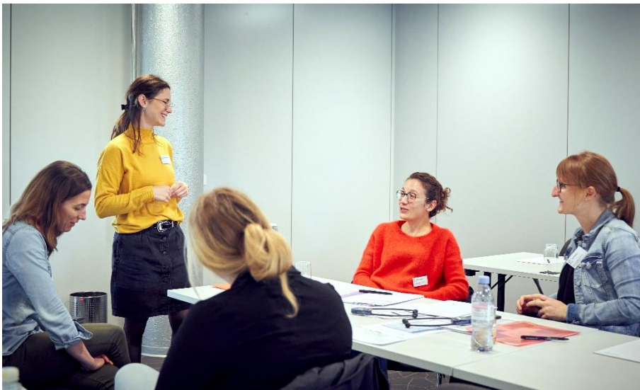
Treffen der Gruppenleiter/innen vom 27. Oktober 2022

Auch die Zusammenarbeit mit Partnerorganisationen hatte im Jahr 2022 eine hohe Priorität. So wurde u.a. eine Partnerschaft mit SWAN etabliert. Die möglichen Inhalte einer Kooperation wurden mit der SVDE-Interessengruppe RIPE abgesprochen und mit SWAN in einer Vereinbarung festgehalten. So können die Mitglieder von SWAN und SVDE nun gegenseitig von Aktivitäten profitieren und es haben auch schon erste gemeinsame Veranstaltungen stattgefunden. Auch die langjährige Partnerschaft mit der SGE wurde gemeinsam weiterentwickelt und in einer aktualisierten Vereinbarung festgehalten.