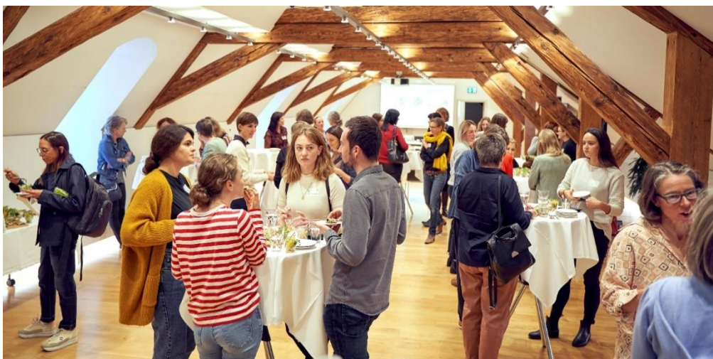
Tag der Berufsidentität vom 14. Oktober 2022

Zusätzlich zum alljährlichen Treffen mit den Gruppenleiter/innen wurde 2022 ausserdem ein Tag der Berufsidentität durchgeführt. An dieser ganztägigen Veranstaltung waren alle Mitglieder eingeladen, ihre Ansichten zu drei wegweisenden Themen unseres Berufsstands einzubringen: Qualitätsentwicklung, Tarifverhandlungen und Advanced Practice Dietitian (APD).