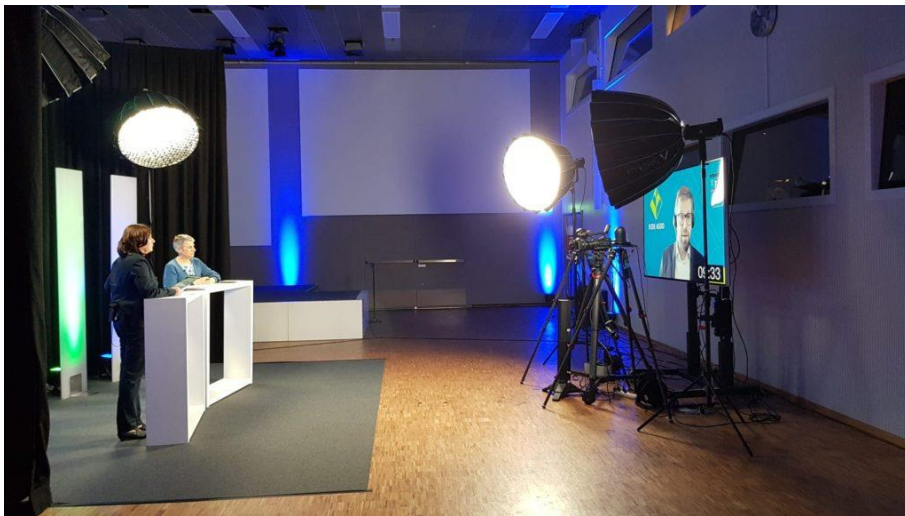
NutriDays 2022: Studio für den Online-Kongress

Die Vernetzung und der Fachaustausch unter den Mitgliedern hatten auch 2022 einen grossen Stellenwert. Die NutriDays 2022 konnten durchgeführt werden, nachdem die Pandemie in den beiden Vorjahren einen Unterbruch erzwungen hatte. Für die Planungssicherheit wurde rechtzeitig entschieden, die NutriDays als reine Online-Veranstaltung durchzuführen. Von diesem Angebot haben die Mitglieder regen Gebrauch gemacht und konnten inhaltlich profitieren.